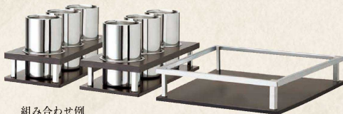
組み合わせ例 トローリーワゴン バーラック C トローリーワゴン ボトルクーラーホルダー 3 本用 × 2 W800 × D500mm