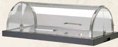
① ペイストリー・チーズカバートップ用 3190451683 〈BRO-03〉 目 1-1250-0101 ¥1,092,000 W900×D500×H300 両側から開閉できます。保冷剤20個付