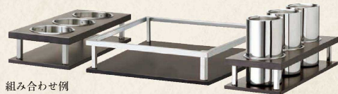
組み合わせ例 トローリーワゴン バーラック C トローリーワゴン ボトルホルダー 3 本用 トローリーワゴン ボトルクーラーホルダー 3 本用 W800 × D500mm