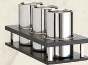
⑤ ボトルクーラーホルダー 3本用 3190451692 〈BRO-07〉 目 1-1250-0501 ¥292,000 W200×D500×H215 内寸 Ø100×H180