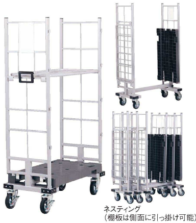
ネスタイング (棚板は側面に引っ掛け可能)