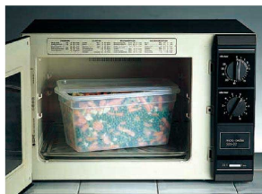
食材を移すことなくそのまま電子レンジへ。