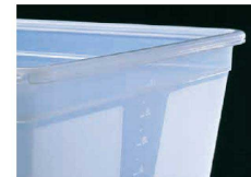
各コンテナの側面には一目でわかる便利な目盛付。