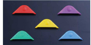
カラークリップで分類