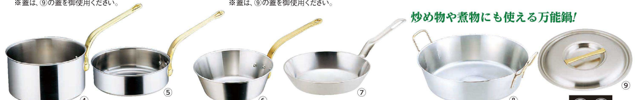
4 Ωスーパーデンジ シチューパン(蓋無) (AST-96) IH 100V/200V