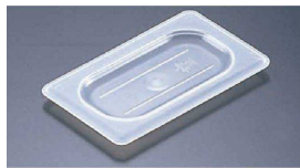
④ 半透明フードパン用 平面カバー (AHC-55)