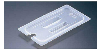
③ 半透明フードパン用 切込・取手付カバー (AHC-54)