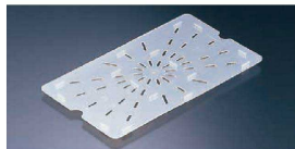
⑤ 半透明フードパン用 ドレンシエルフ (水切目皿) (AHC-52)