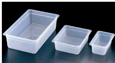
① 半透明フードパン (AHC-51)