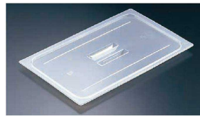
② 半透明フードパン用 取手付カバー (AHC-53)