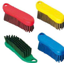
⑤ HPM ハンド 磁性ブラシ L (JZS-02) ④ ¥4,700 1-1307-0501 レッド 57042 1-1307-0502 イエロー 57043 1-1307-0503 グリーン 57044 1-1307-0504 ブルー 57045 50×190 毛長:30