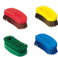
④ HPM ニューハンド 磁性ブラシ S (JZS-01) ④ ¥4,500 1-1307-0401 レッド 57032 1-1307-0402 イエロー 57033 1-1307-0403 グリーン 57034 1-1307-0404 ブルー 57035 45×120 毛長:25