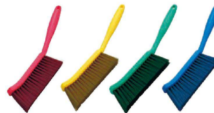
⑥ HPM ベーカリー 磁性ブラシ (JZS-05) ④ ¥5,400 1-1307-0601 レッド 57052 1-1307-0602 イエロー 57053 1-1307-0603 グリーン 57054 1-1307-0604 ブルー 57055 35×110×全長350 毛長:50