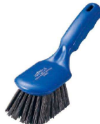
② ショートハンドルブラシ D4-RMDX (JYN-38) ④ 1-1307-0201 ¥8,350 80×100×全長254 材質:本体/ポリプロピレン 毛/ハードポリエステル毛