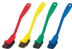
⑧ HPM ディッシュ 磁性ブラシ スリム (JZS-03) ④ ¥4,100 1-1307-0801 レッド 57012 1-1307-0802 イエロー 57013 1-1307-0803 グリーン 57014 1-1307-0804 ブルー 57015 22×45×全長290 毛長:25