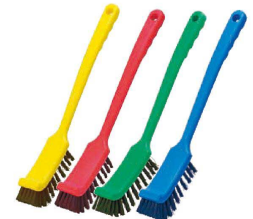
⑦ HPM ロングハンドル 磁性ブラシ (JZS-06) ④ ¥6,100 1-1307-0701 レッド 57002 1-1307-0702 イエロー 57003 1-1307-0703 グリーン 57004 1-1307-0704 ブルー 57005 45×70×全長435 毛長:40