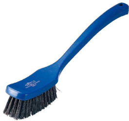
① ロングハンドルブラシ D9-RMDX (JYN-39) ④ 1-1307-0101 ¥9,700 65×120×全長406 毛長:40