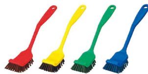
⑨ HPM ディッシュ 磁性ブラシ ワイド (JZS-04) ④ ¥4,500 1-1307-0901 レッド 57022 1-1307-0902 イエロー 57023 1-1307-0903 グリーン 57024 1-1307-0904 ブルー 57025 45×40×全長290 毛長:20