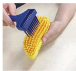
⑩ メンテナンスブラシ (残渣取りブラシ) 11231 (JMV-02) ④ 1-1307-1001 ¥1,450 150×70×H55 クシの長さ:40mm 材質:ポリプロピレン ●長いクシがブラシに付属した残渣やホコリをしっかりと掻き取ります。