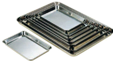
① 18-0 ケーキバット (ABT-17)