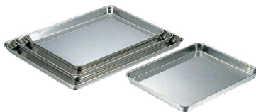
⑧ 18-8 角盆 (AKK-10)