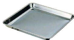
⑨ 18-0 正角盆 (ASY-19)