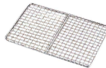
⑦ 18-8 ケーキバット用 クリンプ目アミ (ABT-F4)