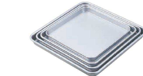
⑩ アルマイト 角膳 (AKK-11)