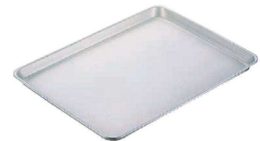
⑤ IKD18-0 抗菌 フッ素加工 ケーキバット (AGY-43)