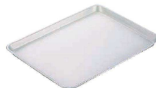
⑭ IKD18-0 抗菌 フッ素加工 肉バット (AGY-44)