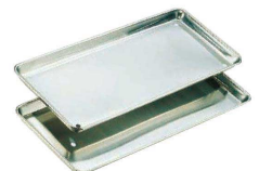
⑪ 18-8 切身バット (ABT-21) ¥2,600