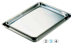
③ エコクリーン IKD18-0 ケーキバット (AEK-36)