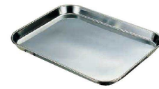
⑮ 18-8 肉バット (ABT-20)

●フッ素樹脂加工により食材がくっつきにくく、お手入れが簡単で酢・酸等に対する耐久性が抜群です。 ※耐熱温度120℃直火及びオープンでのご使用はできません。