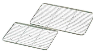
⑥ 18-8 ケーキバットアミ (ABT-18)

●フッ素樹脂加工により食材がくっつきにくく、お手入れが簡単で酢・酸等に対する耐久性が抜群です。 ※耐熱温度120℃直火及びオープンでのご使用はできません。