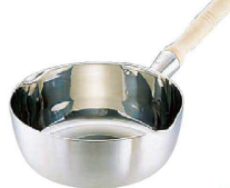
② スーパーデンジ 雪平鍋 (IH) (100V/200V) (クラッド鋼) (AYK-46)