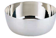
③ スーパーデンジ 矢床鍋 (IH) (100V/200V) (クラッド鋼) (AYT-07)