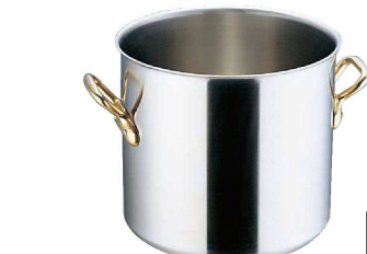
④ エコクリーン スーパーデンジ 寸胴鍋 (IH) (100V/200V) (蓋無) (内面ゼロクリア2コート加工) (AEK-01)