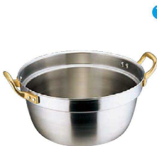
⑦ エコクリーン スーパーデンジ 円付鍋 (IH) (100V/200V) (内面ゼロクリア2コート加工) (AEK-04)