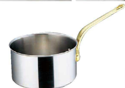
⑥ エコクリーン スーパーデンジ シチューパン (IH) (100V/200V) (蓋無) (内面ゼロクリア2コート加工) (AEK-03)