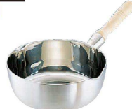
⑧ エコクリーン スーパーデンジ 雪平鍋 (IH) (100V/200V) (内面ゼロクリア2コート加工) (AEK-05)