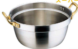
① スーパーデンジ 円付鍋 (IH) (100V/200V) (ADV-03)