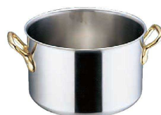
⑤ エコクリーン スーパーデンジ 半寸胴鍋 (IH) (100V/200V) (蓋無) (内面ゼロクリア2コート加工) (AEK-02)