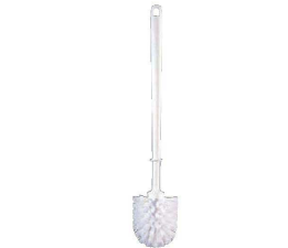
⑤ トラスト プラスチック柄 トイレブラシ 6792

〈KTL-H7〉 1-1443-0401 ¥1,900 130×120×全長500 ブラシ部:φ50