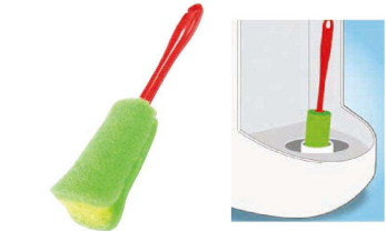
⑨ キクロン キズノン目皿ポットクリーナー