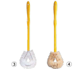
③ トラスト プラスチック柄 トイレブラシ 6796

〈KTL-H5〉 1-1443-0201 ¥1,500 120×130×全長510 ブラシ部:φ50