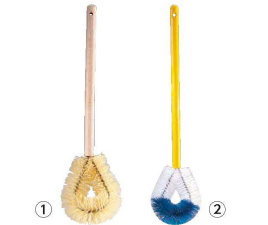
① トラスト 木柄トイレブラシ 6791

トラスト トイレブラシ 材質・ポリプロピレン毛 ①～⑥ 洋式にも和式にもご使用できます。