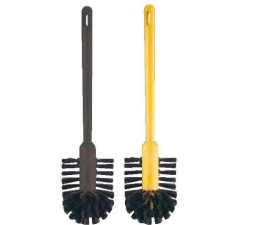
⑥ トラスト プラスチック柄 トイレブラシ 6794

〈KTL-H3〉 1-1443-0501 ¥1,000 φ80×85×全長420