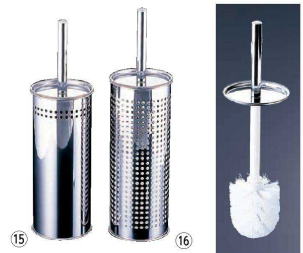
⑮ ワルトトイレブラシ

⑮ ステン 〈KTI-33〉 1-1443-1501 ¥4,000 φ104×H365