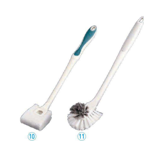
⑩ トイレブラシII Bタイプ CE-488-660-0