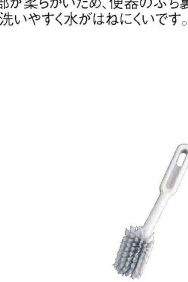
⑭ スポットクリーン