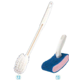
⑫ トイレブラシ K型