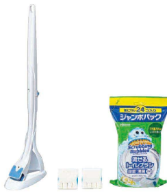
⑦ 流せるトイレブラシ 除菌消臭プラス

〈KTL-H4〉 ¥2,000 1-1443-0601 ブラック 1-1443-0602 イエロー φ105×130×全長430