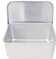
⑩ アルマイト 重なるパン箱 (蓋付) TA-30(25~35人対応)

(APV-21) 1-0146-0901 ¥28,800 本体:363×285×H153 蓋:375×294×H 15