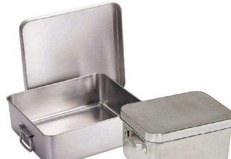
⑭ 18-8 天ぷら入 (蓋付) (ATV-33) 1