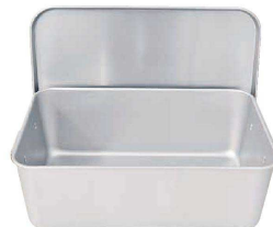
⑪ アルマイト 重なるパン箱 (蓋付) TA-40(35~45人対応)