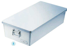
⑧ アルマイト 給食用 パン箱浅型 (蓋付) 260(60個入)

1-0146-0702 259 本体:535×385×H250 ¥67,500 (60個入) 蓋:555×405×H 21