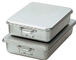
⑬ アルマイト 天ぷら入 (蓋付) (ATV-17) 1