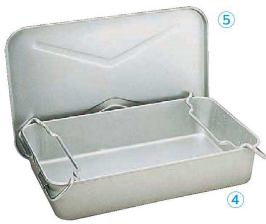
④ アルマイト 漁缶 280-A

(AGY-35) 1-0146-0401 ¥16,000 610×387×H125