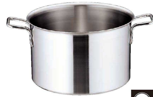
② トリノ 半寸胴鍋 (AHV-99)