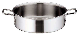
③ トリノ 外輪鍋 (AST-H3)