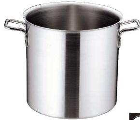
① トリノ 寸胴鍋 (AZV-75)

パワー入力、熱伝導、熱効率にすぐれた材質・構造 鍋全体で温める為、焦げ付きにくく煮物・カレー・シチューには最適! 平ピス使用で洗浄ラクラク、ハンドルはプロ向き!