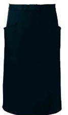
⑧ アンクル加工ソムリエ前掛 (SME-81) H