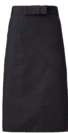
④ ソムリエ前掛 A-1591 (ブラック)