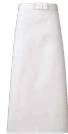
⑦ ソムリエ前掛 丈長 A-1737 (ホワイト)

サイズ: フリー・前中心丈80cm 身巾98cm・紐長246cm・紐巾2.5cm ポリエステル80%+綿20% 交織制御ポプリン