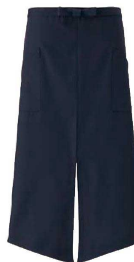
⑥ ソムリエ前掛 A-1814 (スミクロ)