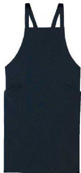
① 胸当てエプロン ブラック GT3603-B9