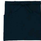
③ 腰下エプロン ブラック GT4605-B9