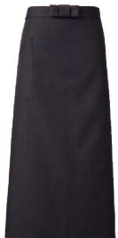
⑤ ソムリエ前掛 丈長 A-1675 (ブラック)

サイズ: 前丈70cm ポリエステル80%+綿20% 交織ポプリン ●ポケット付