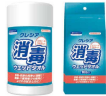
⑥ フレシア 消毒ウェットタオル (100枚入) (XTO-07) 1-1551-0601 本体 15 ¥1,280 1-1551-0602 詰替用 20 ¥1,120 シートサイズ:140×200