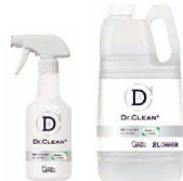
⑩ エステドクタークリーン 除菌・ウイルス除去スプレー (XDK-05) 1-1551-1001 500ml (16) ¥1,680 1-1551-1002 20詰替用 (4) ¥5,980 ●1日1回の使用で持続性のある除菌・ウイルス除去効果を得られます。 ●同じ場所に繰り返し使用することで、クリーンな環境と同時に抗菌効果も高まります。 ※手指、食品・まな板、食器、レンズ等にはご使用できません。