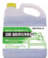
⑦ ケミガード ふいてウイルス除去 (JKM-04) 1-1551-0701 ¥1,800 4kg (4) ●トリプル洗浄効果でサッとふくだけで汚れ、菌、ウイルスを同時に除去します。 ●アルコールに弱いアクリル製パーテーションやビニールカーテンにも使えます。 ●グレープフルーツの香り。 ●弱アルカリ性