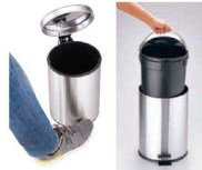
①トラスト ステンレス ラウンドコンテナ (KTL-O7)