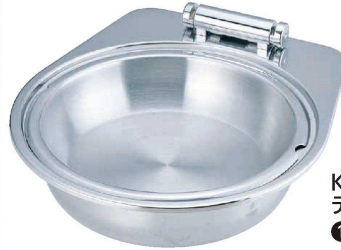
KINGO ステンレス IH丸チャーフィング ディッシュ フードパン無