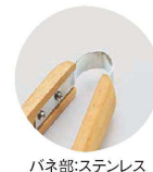
パネ部:ステンレス