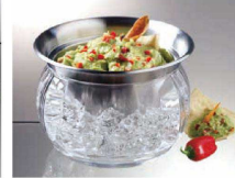
③ プロダイン アイス・ディップ IC-6 〈LPL-13〉 1-1666-0301 ¥7,020