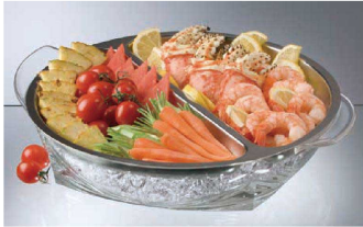
① プロダイン アイス・アペタイザー IC-50 〈LPL-12〉 1-1666-0101 ¥15,600