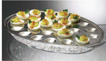
② プロダイン アイス・エッグ IC-24(24穴) 〈LPL-14〉 1-1666-0201 ¥12,900