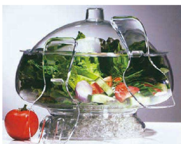
⑧ プロダイン サラダ・オン・アイス AB-3-D (ドームカバー付) 〈LSL-23〉 1-1666-0801 ¥12,300