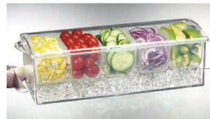
⑨ プロダイン アクリル コンジメント・オン・アイス AB-6 〈LPL-08〉 1-1666-0901 ¥9,700