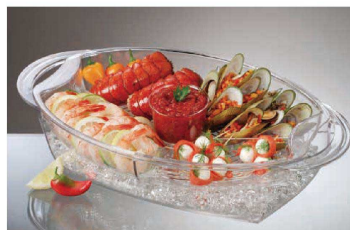
⑥ プロダイン アクリル ビュッフェ・オン・アイス AB-7 〈LPL-06〉 1-1666-0601 ¥12,900