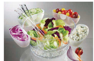
⑦ プロダイン アクリル オービットボール・オン・アイス AB-4 〈LPL-07〉 1-1666-0701 ¥10,900