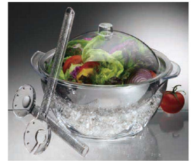
④ プロダイン アイス・サラダ IC-30 〈LPL-11〉 1-1666-0401 ¥17,600