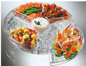
⑤ プロダイン アペタイズ・オン・アイス AB-5 〈LAP-01〉 1-1666-0501 ¥14,100

オン・アイス シリーズ (⑤~⑨) 氷を底に敷き、サラダフルーツなどを保冷、新鮮さを保ち冷たく提供できます。