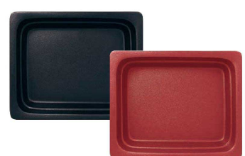
7 ラック ガストロノームパン 角型 1/2 (NMY-05) 洗 OK ¥12,000 1-1694-0701 ブラック RA1208GNSB 1-1694-0702 レッド RA1208GNDR 325×265×H65 3.3㍓

KINGOチェーフィング・TKG和風ビュッフェにもセットしてご使用いただけます。