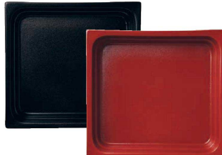
6 ラック ガストロノームパン 角型 2/3 (NMY-07) 洗 OK ¥13,000 1-1694-0601 ブラック RA2308GNSB 1-1694-0602 レッド RA2308GNDR 354×325×H65 4.7㍓