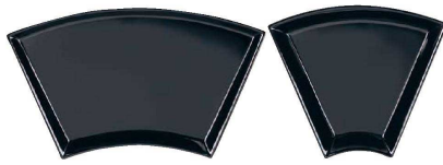
3 ラック B-コンセプト ビュッフェディッシュ ブラック (NMY-09) 洗 OK 1-1694-0301 大 510×300×H35 ¥18,500 1-1694-0302 小 300×260×H43 ¥12,500