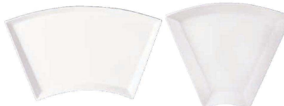
4 ラック B-コンセプト ビュッフェディッシュ ホワイト (NMY-08) 洗 OK 1-1694-0401 大 510×300×H35 ¥12,500 1-1694-0402 小 300×260×H43 ¥8,500