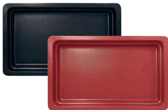
5 ラック ガストロノームパン 角型 1/1 (NMY-04) 洗 OK ¥24,000 1-1694-0501 ブラック RA1108GNSB 1-1694-0502 レッド RA1108GNDR 530×325×H65 7.3㍓

⑤～⑧材質：磁器 ※直火ではご使用になれません。耐熱温度：300℃ ●オープンはもちろん、電子レンジ、食器洗浄機にも対応しています。