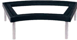
2 ラック B-コンセプト ウッズスタンド 大 (NMY-10) ¥1-1694-0201 ¥75,000 510×300×H50・100・140(3段階) ①② 材質：脚部/ステンレス ●高さや向きを変えて組み合わせることで、様々な演出ができます。