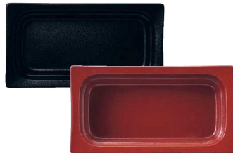
8 ラック ガストロノームパン 角型 1/3 (NMY-06) 洗 OK ¥7,500 1-1694-0801 ブラック RA1308GNSB 1-1694-0802 レッド RA1308GNDR 325×176×H65 2.0㍓

KINGOチェーフィング・TKG和風ビュッフェにもセットしてご使用いただけます。