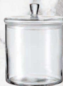
⑦ プロジ グラスジャー 4041031304 <BRO-45> E 1-1696-0701 ¥14,500 φ140×H190 1.5L 材質:ソーダガラス、シリコン