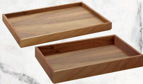
② プロジ ウッドトレイ <BRO-17> E 1-1696-0201 350×525×H45 ¥50,000 1-1696-0202 350×525×H80 ¥65,000 材質:ウォールナット