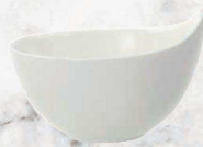
⑫ プロジ アーバンボウル 0.6L 2634521900 <BRO-50> E 1-1696-1201 ¥8,900 φ145×H80 0.6L 材質:磁器