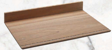
③ プロジ インクリネートベース <BRO-19> E 1-1696-0301 ¥51,000 350×525×H67 材質:ウォールナット