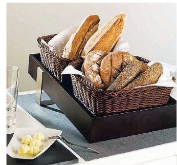
写真は①プレゼンター、③ボードインサート、⑤樹脂バスケット31、⑥プレゼンター用スタンドを組み合わせています。