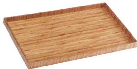
⑩ カル・ミル バンブートレイ 1367-12-60

●ジャーはガラス部の下にアイスバック(付属)をセットできるので、保冷して新鮮に保ちます。 ●トレイには蓋を立てられる切込み付。