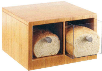
① カル・ミル バンブー 2ドローブレッドピン 1337-60

〈NKL-12〉 1-1705-0101 ¥159,000 355×340×H218 1ヶあたり 内145×305×深さ145 材質: フレーム/竹集成材 ドローブ/PETG樹脂