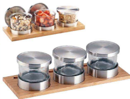
⑨ カル・ミル バンブー ジャー

ディスプレイ 1850-4-60 〈NKL-17〉 1-1705-0901 ¥54,300