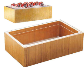
⑫ カル・ミル バンブー アイスハウジング 〈NKL-19〉

●パンくずが皿の下に落ちるのできれいにカットできます。 ●皿はマグネットで固定されますので、スレにくくなっています。