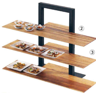
② カル・ミル 3段フレームライザー ブラック 1464-13

〈NKL-21〉 1-1705-0201 ¥74,000 470×295×H640 材質: スチール粉体塗装 ※ 棚板は別売です。③3段フレーム用棚板をご使用ください。