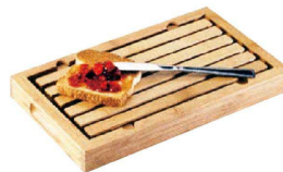
⑪ カル・ミル バンブー クランプキャッチャー 823

〈NKL-27〉 1-1705-1001 ¥19,500 500×300×H35 材質: 竹集成材