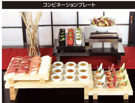
コンビネーションプレート