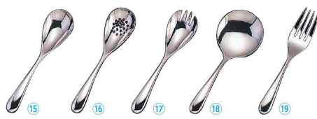
15 18-8 ホームフェスティルシリーズ サービングスプーン (LSC-08) 1-1757-1501 ¥2,700