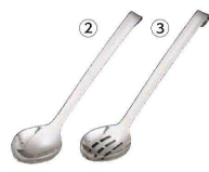
2 18-8 ワンピース コックスプーン

(BWV-05) 1-1757-0201 ¥1,900 70×110 柄長: 245