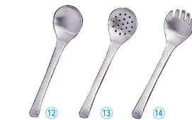
12 18-8 嵯峨野 和風盛り付けスプーン (LML-03) 1-1757-1201 ¥800