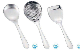
25 ののじ 18-8 ユニバーサル オタモ 小 LTM-S01 (OYN-07) 1-1757-2501 ¥1,500