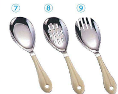
7 18-8 らくらくサーバー 穴無 (LSC-11) ¥1,250