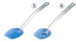
5 18-8 シリコン 長柄スプーン 01/3W41J