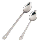
4 18-0 ビッグサービングスプーン (LSC-18)

(BWV-06) 1-1757-0301 ¥1,900 70×110 柄長: 245