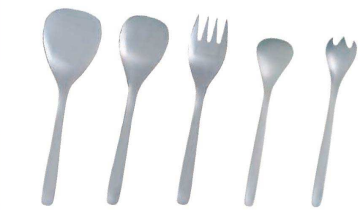
1 柳宗理#1250ステンレスカトラリー (OYN-22)