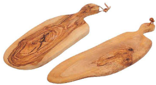
① ドリスオリーブ ロングボード ハンドル (NBO-02)