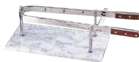
⑫ ハムホルダー 大理石 #34048

(NHM-04) 1-1788-1201 ¥103,500 480×280×H160