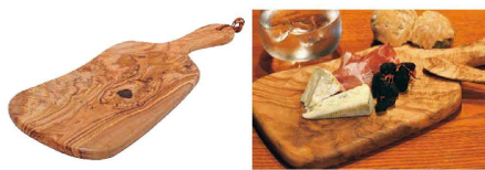
② ドリスオリーブ ラウンドボード ハンドル (NBO-01)