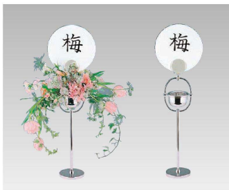
① UK 18-8 テーブルナンバー フลาวースタンドA 〈NTC-64〉 1-1795-0101 ¥43,000 φ120×H560 ※プレートは別売です。(⑩参照ください。)