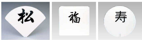
〈印刷〉行書体 〈細〉 〈印刷〉行書体 〈太〉 〈印刷〉教科書体 〈彫〉丸ゴシック体