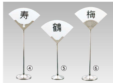
UK18-8 テーブルナンバー スタンド ④ 瑞雲 〈NTC-03〉 1-1795-0401 ¥12,800 φ150×H570 ⑤ 松葉 〈NTC-04〉 1-1795-0501 ¥12,400 φ120×H400 ⑥ 末広 〈NTC-01〉 1-1795-0601 ¥12,800 φ150×H570 ※プレートは別売です。(⑩参照ください。) ※④～⑥高さ調節式もあります。