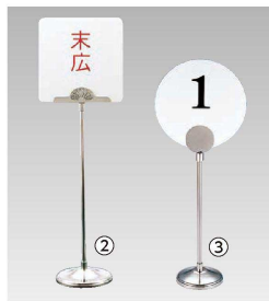
UK18-8 テーブルナンバー スタンド ② 菊 〈NTC-02〉 1-1795-0201 ¥12,400 φ150×H510 ③ 丸型 〈NTC-05〉 1-1795-0301 ¥12,400 φ120×H400 ※プレートは別売です。(⑩参照ください。) ※②③高さ調節式もあります。