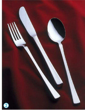
② 18-8シャイン (ハンドルサテン仕上) (OSY-14) U