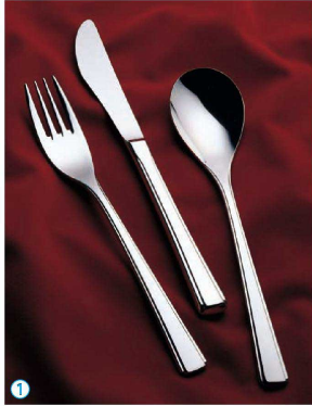
① 18-8T-7500 (ミラー仕上) (ONN-02) U