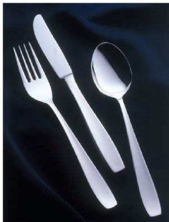
⑤ 18-8ニューライラック (ハンドルサテン仕上) (ONY-04) U