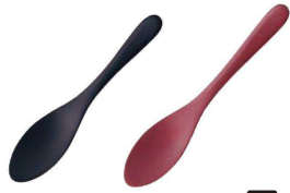
① PP ぐるめスプーン (OGL-01) 洗