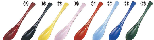
⑮ かゆスプーン 朱 (OKY-01) 1-1843-1501 ¥290 全長:195