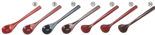
⑧ 茶碗蒸しスプーン 朱 (OTY-04) 1-1843-0801 ¥170 全長:132

※溜色に関しまして、漆配合の関係上、写真の色とは異なる場合があります。御了承下さい。