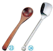
⑳ 木製 茶碗蒸しスプーン(溜塗) (OTY-02) 1-1843-2301 ¥710 全長:135