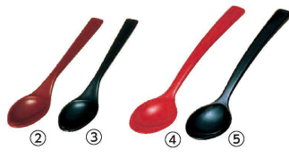
② デザートスプーン 小 朱塗 (RSP-02) 1-1843-0201 全長:110 ¥310

幅:35 耐熱温度:120℃ 耐冷温度:-20℃ ● 深く細長い皿形状なのでお口の小さい女性でも食べやすく、口に入れてスッと抜けるので食べ心地も抜群です。 ● すくいやすい先端肉薄形状なので、チャーハンのご飯粒やカレーのルーも最後までストレスなくすくえます。