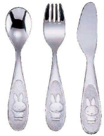
⑤ 18-10ミッフィーレリーフ おはよう (OMT-05)