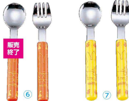
⑥ 18-10ミッフィーカラー ごちそうさま (OMT-07) 目 ¥600