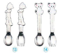
⑬ 18-10 マイティアトム 無地 アトム (OMI-04) 目 ¥300