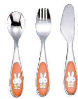
④ ミッフィーカラー こんにちは (OMT-06)