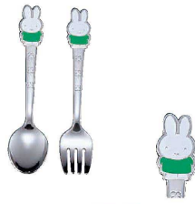
② ミッフィー お子様 おともだち 緑 (OMT-04) ¥700