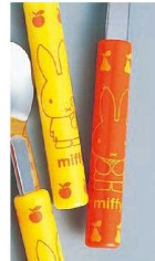
⑦ 18-10ミッフィーカラー くまちゃんといっしょ (OMT-08) 目 ¥600