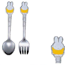
① ミッフィー お子様 おともだち 黄 (OMT-03) ¥700