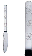
⑧ 18-10ミッフィー アラカルト デザートナイフ (OMT-01) 1-1849-0801 ¥700 全長:183