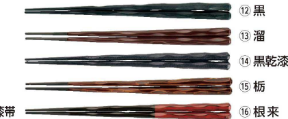
PBT六角一刀彫箸(10膳入)