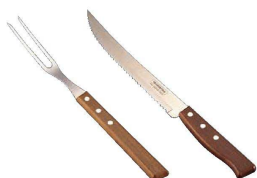
⑪ トラモンティーナ カービングセット 22299/012 (OTL-24) 1-1886-1101 ¥6,400 ナイフ/全長:350 刃渡り約210 フォーク/全長:325