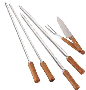
⑦ トラモンティーナ BBQスキューアー シングル (OTL-25) 目 cm 全長 串部分 1-1886-0701 26417/065 65 650 510 ¥3,000 1-1886-0702 26417/075 75 750 610 ¥3,100 ●お肉は勿論、比較的小さな魚介や野菜も刺せる細身なスキューアーです。