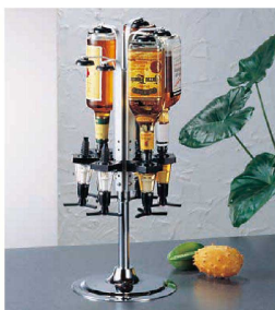
交換用部品 ポーラーのみ

⑨ ビール泡きり 149-86 (PBC-E6) 目 1-1939-0901 ¥700 全長:230 材質:ポリスチレン ●グラスに盛り上がったきめの粗い余分な泡をきれいにカットする専用ツールです。 ●使いやすさ・ひねりを付けた独自の形状です。