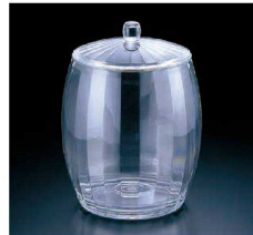
⑥ アクリル二重アイスパケット AP-98 〈PAI-AA〉 目 1-1946-0601 ¥10,600 3.4ℓ φ190×H265 ●内側の仲子は、取りはずし可能です。