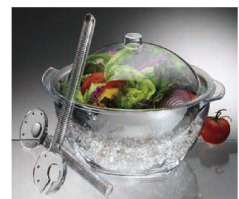
⑩ プロダインアイス・サラダ IC-30 〈LPL-11〉 目 1-1946-1001 ¥17,600 φ300×H230 材質: 下ボウル/ポリスチレン サラダボウル/ステンレス (深さ105) カバー/アクリル サラダサーバー/アクリル (全長320) ●サラダサーバー付。