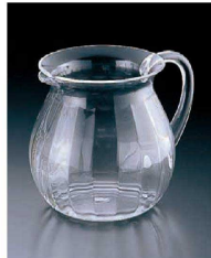
⑤ プロダイン アクリルピッチャー AP-23 〈PPT-46〉 目 1-1946-0501 ¥7,300 2.5ℓ φ148×H180