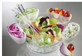
⑨ プロダイン アクリルオービットボール・オンアイス AB-4 〈LPL-07〉 目 1-1946-0901 ¥10,900 ボウル: φ280×H150 サイドカップ: 170×70×H65 (ポリプロピレン) サラダサーバー: 全長335 (アクリル) ●スタンド部に氷を入れてサラダを保冷、新鮮さを保ちます。 ●クリップオンでボウルに取り付けできるサイドカップが4ヶ付属。ソースやトッピング入れに便利です。 ●サラダサーバー付。