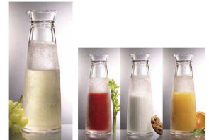
① プロダイン アクリルフレーバーピッチャー FI-3 〈PUO-C6〉 目 1-1946-0101 ¥8,500 2.4ℓ 195×140×H270 ●好みのカットフルーツなどを入れるだけで、手軽にフレーバードリンクができます。