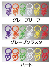
⑦ プロダイン シリコンステムウェアチャームセット WC-3 (6色セット) 入販 〈LPL-28〉 目 ¥2,300 1-1946-0701 L グレーブリーフ 1-1946-0702 G グレーブクラスタ 1-1946-0703 H ハート 約45×25 ●ワイングラスのステムに引っかけて使用するグラスマーカーです。自分のグラスがどれかがひと目でわかります。