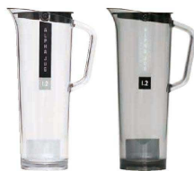
⑧ アルファジャグ 1.2ℓ 〈PAL-17〉 1-1966-0801 クリア 1-1966-0802 クリアブラック 151×97×H270 材質: 本体/AS樹脂 フタ/ポリプロピレン 耐熱温度: -20~100℃ ●熱湯を入れてもご使用できます。 ●水切れのいい注ぎ口です。