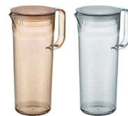
⑨ クリアジャグ 〈PKL-G0〉 1-1966-0901 ブラウン 1-1966-0902 ブルー 1ℓ 145×105×H235 ¥1,600 材質: 本体/AS樹脂 パッキン/シリコンゴム(1ℓのみ) ●広い間口なので、お手入れが簡単です。 ●フタの前後で2タイプの注ぎ口にできます。

フタの取り付け方: フタ を本体の凹みに合わせ て、両端を上から押しこ みます。