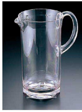
① プロデザイン アクリル フォーエバーピッチャー AF-54 〈PPT-K2〉 1-1966-0101 ¥6,200 1.75ℓ φ122×H220