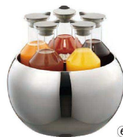
⑥ フレリッ ガラスエレガンスカラフェ ESC-060E (5本セット) 〈PZY-37〉 1-1966-0601 ¥324,000 カラフェサイズ: φ100×H280 1.2ℓ 材質: ボウル/ステンレス カラフェ/本体 ガラス フタ ステンレス ●ボウルは、二重構造なので保冷効果が あります。 ●センターの仕切りがチューブ状になっ ています。 ●クラッシュアイスを入れることができ、さら に保冷効果を高められます。 ●専用カラフェ以外にもワインボトルがそ のまま入れられるので、ワインクーラーと してもご使用いただけます。