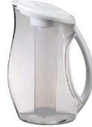
③ プロデザイン アクリル アイス・ピッチャー IP-104-C クリア 〈LPL-10〉 1-1966-0301 ¥9,500 2.5ℓ 200×160×H270 ●取り外し可能なアイスコアに水を入れて 冷凍庫で凍らせて使います。飲み物を 清めず冷たさを保ちます。