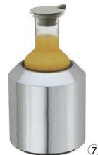
⑦ フレリッ ガラスエレガンスカラフェ ESC-012E 〈PZY-38〉 1-1966-0701 ¥90,000 カラフェサイズ: φ100×H280 1.2ℓ 材質: ベース/ステンレス、プラスチック 保冷パック/ポリエチレン カラフェ/本体 ガラス フタ ステンレス ●保冷パック1個付属。 ●ジュースの冷たさをキープします。 ●ワインボトルが入れられるので、ワイン クーラーとしてもご使用いただけます。