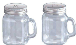
⑨ アメリカンメタルクラフト ガラスソルト&ペッパー シェーカーセット MSP4 <PSL-P4> 1-1986-0901 ¥2,660 55×74×H84