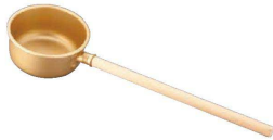
④ ゴールド アルマイト 水杓 (AMZ-15)