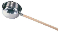
② Ω18-8 水杓子 (AMZ-01)