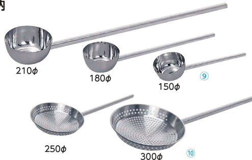
⑨ ステンレス 一体型 角柄ひしゃく (AHS-36) 目

一体成形により洗浄性が向上。 ステンレスグリップを四角(25mm角)にする事でグリップの滑りを抑制し、操作性が向上。