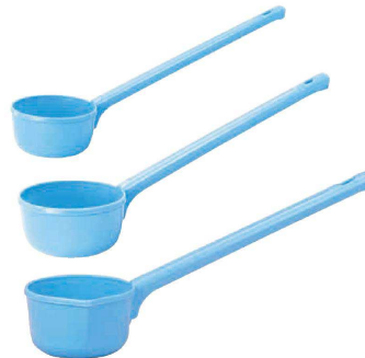
⑧ ポリプロピレン 水ひしゃく (AMZ-17) 目