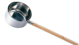
⑥ Ω18-8 そば杓子 (目盛付)

<BSB-01> 1-0200-0601 ¥4,200 φ160×全長約510 1,800c.c.