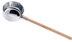
① 21-0 口付水杓子 (AMZ-10)