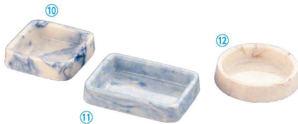
マーブル灰皿 (ポリエステル)