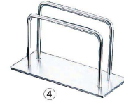
④ 18-8 メニュー立 J-1 (PMN-FU) 1-2072-0401 ¥1,850 150×65×H95 有効幅:15