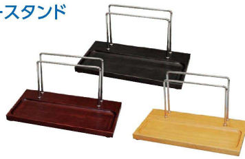
② カスタートレイ&メニューブックスタンド OSE-66 (PKS-A9) ¥3,500 1-2072-0201 白木 1-2072-0202 茶 1-2072-0203 黒 247×128×H130 有効幅:20