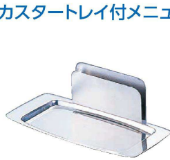
① 18-8 メニュー立 J-2 (PMN-FT) 1-2072-0101 ¥3,100 250×120×H80 有効幅:10