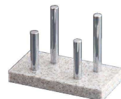
⑮ メニュー立て MT451S-2 (PBT-C3) ¥1-2072-1501 ¥3,600 100×50×H71 有効幅:12 材質:人工大理石/真鍮製