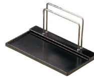
③ メニュー立(カスター付)黒 M44-030 (PAA-91) 1-2072-0301 ¥2,800 269×150×H130 有効幅:10 ベース材質:フェノール樹脂