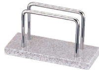
⑭ メニュー立て MT614S-2 (PBT-C1) ¥1-2072-1401 ¥4,600 145×60×H80 有効幅:20 材質:人工大理石/真鍮製