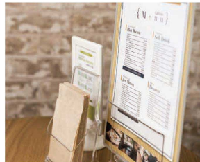
⑰ シンビ 木目柄メニューブック立 (PBT-G1) B

〈PMN-GK〉 1-2073-1601 ¥1,700 100×70×H163 有効幅:21 ●テーブルサイドにおすすめメニューや季節メニューに。