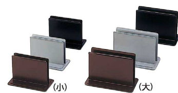
④ えいむ メタルブックスタンド (PBT-C0) B