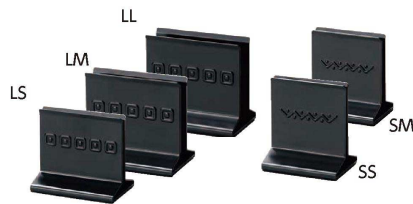
③ えいむ メタルメニューブック立 (PEI-56) B