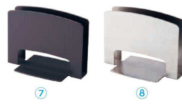
⑦ スチール製メニュースタンド CH-70 ブラック

〈PST-J2〉 1-2073-0701 ¥1,100 120×70×H90 有効幅:20