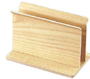
⑲ えいむメニューブックスタンド (PMN-GS) B

1-2073-1801 ダークブラウン ¥1,200 1-2073-1802 ナチュラル ¥1,200 100×60×H115 有効幅:25