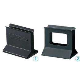
① シンビ メニューブック立 SE-12 ブラック

〈PBT-E9〉 1-2073-0101 ¥1,870 120×75×H105 有効幅:15