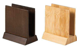
⑱ シンビ 竹製メニューブックスタンド MD-3 (PNH-H8) B

〈PBT-G1〉 1-2073-1701 MD-1 白木 ¥1,900 1-2073-1702 MD-2 茶 ¥1,900 100×60×H115 有効幅:25 ●紙クロス素材貼り