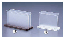
⑪ メニューブック立 EBT-1 大

〈PMT-99〉 1-2073-0901 ¥1,380 109×70×H118 有効幅:23