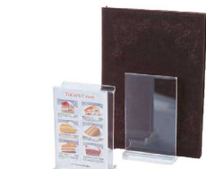
⑯ シンビ メニュースタンド&ブック立 MS-W

〈PBT-F2〉 1-2073-1501 ¥2,100 170×80×H108 有効幅:15