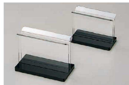
⑬ えいむ アクリルブックスタンド (PBT-B7) B

〈PMN-HC〉 1-2073-1201 ¥1,300 105×50×H78 有効幅:7