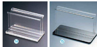
⑭ シンビ アクリルメニューブック立 MS-L

〈PMN-BA〉 1-2073-1401 ¥1,500 120×60×H75 有効幅:15