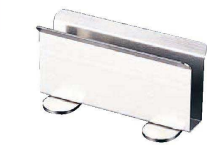
⑤ RK18-8 メニューブック立 (PAA-99)