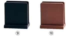
⑨ 樹脂製メニュー立て ブラック M44-180

〈PST-J2〉 1-2073-0701 ¥1,100 120×70×H90 有効幅:20