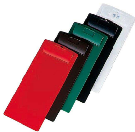
① シンビ 伝票クリップ CLIP-101 (PKI-53) ¥460 1-2082-0101 赤 1-2082-0102 茶 1-2082-0103 緑 1-2082-0104 黒 1-2082-0105 透明 100×230