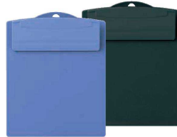
⑭ お会計ボード SB-510 (PKI-83) ¥210 1-2082-1401 SB-510-BU ブルー 1-2082-1402 SB-510-BK ブラック 92×116 材質:再生ABS樹脂