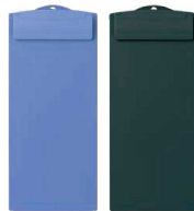
⑬ お会計ボード SB-550 (PKI-82) ¥240 1-2082-1301 SB-550-BU ブルー 1-2082-1302 SB-550-BK ブラック 92×214 材質:再生ABS樹脂