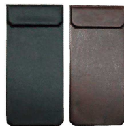
⑩ ロイヤルボードRB-5 (PBC-A8) ¥1,080 1-2082-1001 10601BLK ブラック 1-2082-1002 10601BRN ブラウン 110×230