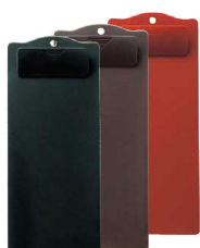
⑥ BH-72 (中) (PEI-58) ¥370 1-2082-0601 ブラック 1-2082-0602 ブラウン 1-2082-0603 レッド 90×220