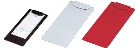
⑪ 伝票クリップ「伝楽」(PDV-65) ブラウン グレー レッド サイズ 大 1-2082-1101 100×230 ¥740 小 1-2082-1102 1-2082-1103 80×180 ¥660 ●片手でラクラク伝票を挟むことができます。 ●通常のクリップ式とは違い、下に引っ張っても伝票が外れにくい構造です。