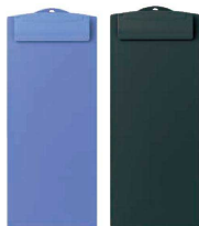
⑫ お会計ボード SB-600 (PKI-81) ¥250 1-2082-1201 SB-600-BU ブルー 1-2082-1202 SB-600-BK ブラック 98×239 材質:再生ABS樹脂