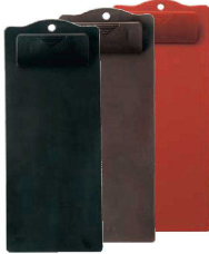
えいむ 成型バイダー ⑤ BH-71 (大) (PEI-57) ¥400 1-2082-0501 ブラック 1-2082-0502 ブラウン 1-2082-0503 レッド 100×238 ⑤~⑦ ●両サイドに手が滑らないようにギザ付きになっています。