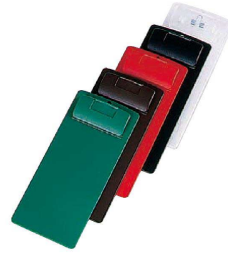
③ シンビ 伝票クリップ CLIP-103 (PKI-55) ¥370 1-2082-0301 赤 1-2082-0302 茶 1-2082-0303 緑 1-2082-0304 黒 1-2082-0305 透明 80×180