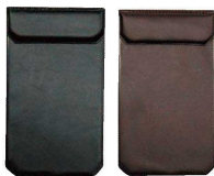
⑨ ロイヤルボードRB-3 (PBC-A7) ¥850 1-2082-0901 10602BLK ブラック 1-2082-0902 10602BRN ブラウン 95×165 ⑨⑩ ●マグネット方式のおしゃれな会計クリップ。