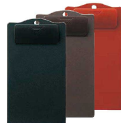
⑦ BH-73 (小) (PEI-59) ¥340 1-2082-0701 ブラック 1-2082-0702 ブラウン 1-2082-0703 レッド 90×165