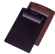
④ シンビ 伝票クリップ CLIP-104 (PKI-56) ¥400 1-2082-0401 茶 1-2082-0402 黒 110×160