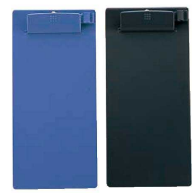
⑮ コクヨ クリップボードE ヨハ-61 (PKI-79) ¥530 1-2082-1501 Bブルー 1-2082-1502 DMダークグレー 110×235 ●複数のクリップボードを整理するのに便利なスタッキング(積重ね)機能付。

カスター! 卓上用調味料入 ナフキン立 箸立・楊枝入 卓上皿・トレー テーブルマット コーンスター 卓上サイン 会計クリップ レシート・伝票 呼び出しチャイム コールシステム