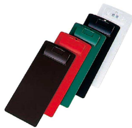
② シンビ 伝票クリップ CLIP-102 (PKI-54) ¥420 1-2082-0201 赤 1-2082-0202 茶 1-2082-0203 緑 1-2082-0204 黒 1-2082-0205 透明 90×210