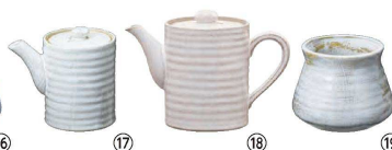
⑰ 乳白 中 だし入 Y-501

(RMJ-60) 1-2120-1601 ¥4,000 φ120×H95 ⑭～⑯瀬戸焼