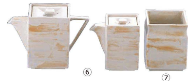
⑥ 白刷毛 スタック角ダシ入 (RDS-08)

(RAK-03) 1-2120-0501 ¥6,400 90×90×H120 ④⑤瀬戸焼