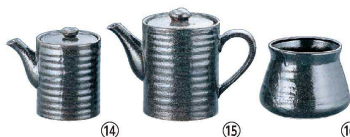
⑭ 瀬戸黒 中 だし入 Y-027

(RAK-06) 1-2120-1301 ¥5,200 120×H95 ⑫⑬瀬戸焼