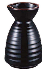
① 天目徳利型だし入れ (RDS-10)

②～⑬のスタックシリーズは同商品サイズごとにそれぞれ積み重ねることができ、収納に便利です。