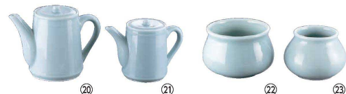
⑳ 青磁 だし入 大 Z-001

(RMJ-K8) 1-2120-1901 ¥5,000 φ120×H95 ⑰～⑱瀬戸焼