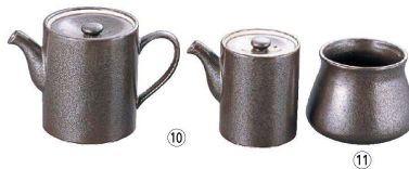
⑩ いぶし黒 スタック丸ダシ入 (RDS-07)

(RAK-02) 1-2120-0901 ¥4,600 120×H95 ⑧⑨瀬戸焼