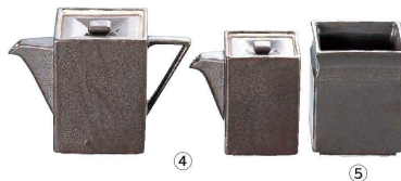
④ いぶし黒 スタック角ダシ入 (RDS-06)

(RAK-01) 1-2120-0301 ¥6,000 90×90×H120 ②③瀬戸焼