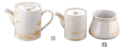
⑫ 白刷毛 スタック丸ダシ入 (RDS-09)

(RAK-04) 1-2120-1101 ¥5,200 120×H95 ⑩⑪瀬戸焼