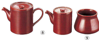
⑧ 柿釉 スタック丸ダシ入 (RDS-05)

(RAK-05) 1-2120-0701 ¥6,400 90×90×H120 ⑥⑦瀬戸焼