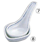
⑦ 一本線レンゲ T05-73 〈RLV-I4〉 1-2122-0701 ¥2,220 125×53