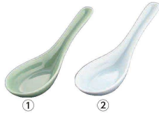
① 天竜青磁レンゲ 33-AZ45R 〈RLV-L4〉 1-2122-0101 ¥950 全長:142 ●強化食器(瑞宝)