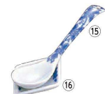
⑮ 染付唐草 小スプーン T05-81 〈RLV-J2〉 1-2122-1501 ¥3,300 135×30