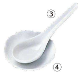
③ 白磁ミニレンゲ T03-257 〈RLV-M9〉 1-2122-0301 ¥620 110×30