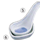
⑤ 線彫レンゲ T05-71 〈RLV-I2〉 1-2122-0501 ¥3,000 125×53