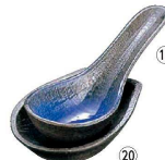
⑲ 伊賀るりレンゲ T03-231 〈RLV-K4〉 1-2122-1901 ¥1,400 130×45