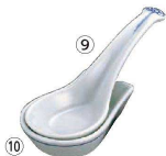
⑨ 瀏唐草レンゲ T05-75 〈RLV-I6〉 1-2122-0901 ¥2,500 140×48