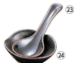
㉓ 柚子天目 小レンゲ T03-239 〈RLV-L2〉 1-2122-2301 ¥2,000 158×55