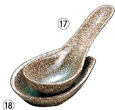
⑰ 新緑ビードロレンゲ T03-229 〈RLV-K2〉 1-2122-1701 ¥1,400 130×45