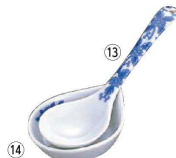
⑬ 染付唐草 大スプーン T05-79 〈RLV-J0〉 1-2122-1301 ¥3,800 140×38