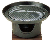
12 アサヒスタミナ コンロセット (鉄製) 〈QST-05〉 1-2137-1201 ¥6,000 皿:φ195×H19 コンロ:φ130×H84