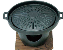
11 卓上焼 ミニ皿セット ジンギスカン (鉄製) 〈QTK-19〉 1-2137-1101 ¥6,000 皿:φ170×H16 コンロ:φ120×H85