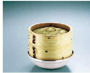
● 杉製ミニ中華セイロ13cmとの組み合わせ例