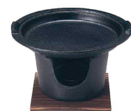
13 アサヒ 炉ばたコンロセット (鉄製) 〈QLB-08〉 1-2137-1301 ¥5,800 皿:φ150×H20 コンロ:φ130×H84