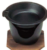
6 卓上焼 ミニ皿 セット片口 (鉄製) 〈QTK-09〉 1-2137-0601 ¥5,300 皿:φ140×H28 コンロ:φ120×H85