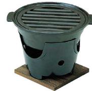
16 アルミ 新グリドル鍋 〈QGL-13〉 1-2137-1601 ¥5,300 φ155×H55 ● 目皿はフッ素加工です。 ※コンロは別売です。 P.2132の Ω やまと鍋コンロセット小に合います。