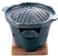
15 アルミフッ素加工 ジンギスカン鍋 64-11 16cm 〈QGV-31〉 1-2137-1501 ¥3,900 φ150×H30 ※コンロは別売です。 P.2132の Ω やまと鍋コンロセット小に合います。