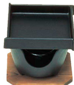
10 卓上焼 ミニ皿 セット角 (鉄製) 〈QTK-11〉 1-2137-1001 ¥5,300 皿:125×125×H22 コンロ:φ120×H85