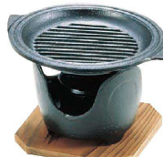
8 卓上焼 ミニ皿 セットグリル丸 (鉄製) 〈QTK-08〉 1-2137-0801 ¥5,300 皿:φ150×H15 コンロ:φ120×H85