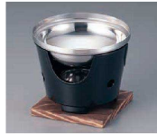
● Ω やまと鍋コンロセット小との組み合わせ例