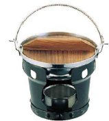
3 アルミ製 寄せ鍋セット 15cm (コンロ鉄製) 〈QYS-03〉 1-2137-0301 ¥5,400 ● 図形燃料皿付