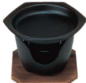
7 卓上焼 ミニ皿 セット六角 (鉄製) 〈QTK-10〉 1-2137-0701 ¥5,300 皿:φ150×H21 コンロ:φ120×H85