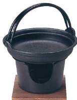
14 アサヒ 鉄 南部 すきやき鍋 コンロセット 〈QSK-41〉 1-2137-1401 ¥11,000 φ150×H140 鍋:深さ30 コンロ:φ130×H84