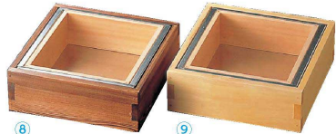
8 電調焼杉枠 湯葉鍋 〔QYB-02〕 1-2140-0801 ¥25,800 243×230×H80 内183×169×H65 ●2~4人用

外鍋 φ160×H72 内鍋 φ127×H44 材質:陶磁器 ●豆腐や茶碗蒸し等が短時間でムラなくできます。 ●蒸し物全般、温野菜、目玉焼き、料理の温めなおし、冷凍食品の調理等幅広く利用できます。