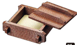
1 せいろ蒸しセット 中洗 ライトブラウン M44-141 (ポリプロピレン) 〔QSI-63〕 1-2140-0101 ¥3,650 183×183×H90