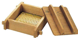
2 ネズコ 角セイロ 〔QSI-09〕 1-2140-0201 ¥3,900 内123×123×H38 ●蓋・すだれ付