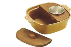
15 アルミ ゆどうぶ鍋 (茶・2枚フタ・仲子付) 〔QYD-02〕 1-2140-1501 ¥7,200 15cm 160×160×H45