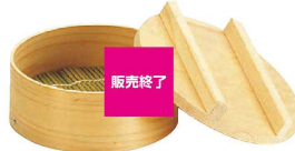
3 M 桧 ワッパセイロ 〔QSI-11〕 ¥4,600 ¥4,600 内φ140×H42 ●蓋・すだれ付