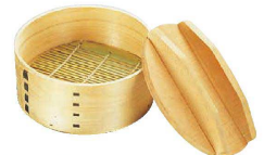
4 H 桧 丸セイロ 〔QSI-17〕 1-2140-0401 ¥5,000 内φ130×H45 ●蓋・すだれ付