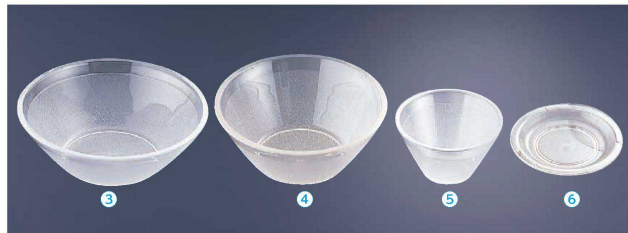
冷麺鉢(ポリカーボネイト)

② 18-8 二重丼 丸型 小 〈RDV-C5〉 I-2168-0201 ¥4,900 φ160×H70 600c.c. 質量:約160g ●二重中空構造で外側に熱くなりにくいので、お子様用食器として安心して使用できます。 ●保温性があり冷めにくいので、つけ麺のスープ用としても最適です。 ●サイドメニューにも使いやすいサイズです。