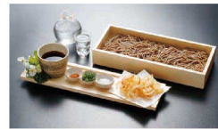
⑫ 桧 箱そばセット NB-204 (QHK-33) ¥15,500 材質: 木製 本体/320×135×H55 盛皿/380×100×H20 竹ス/298×113 ●単品のそばメニューはもちろん、竹すだれを取り、盛皿、盛台、お料理箱として活用できます。