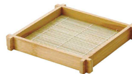
⑮ スス そば盛 スタッキング型 (QMS-05) ¥2,350 215×215×H27 ●スタッキング可能で、使わない時は重ねて収納できます。