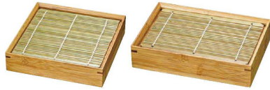
① 竹製 炭化麺皿 (EKT-77) 1-2170-0101 正角 180×180×H47 ¥4,430 1-2170-0102 長角 185×125×H47 ¥4,100