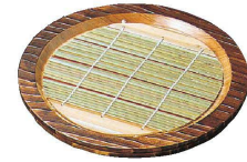
③ 焼杉 盆ざる N-81 (QBV-12) ¥5,140 φ240