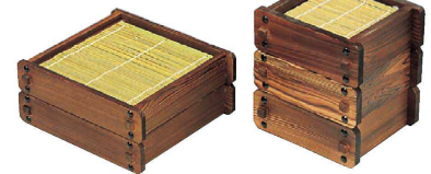
⑬ ネスコ 角セイロ (QKK-12) ¥4,900 1-2170-1301 大 200×200×H50 1-2170-1302 小 145×145×H60