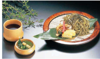
② 杉 盆ざる (QBV-11) ¥6,390 φ240×H25 ※写真のチョコと薬味入れは別売です。 (P.2171 ⑫⑬を参照ください。)