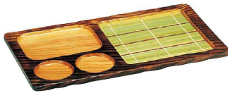
④ 焼杉 天ざる (QTV-09) ¥8,660 380×220