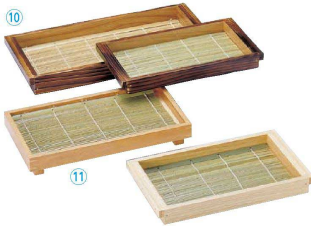
⑩ 焼杉 板そば (塗装付) (QIT-05) ¥5,240 1-2170-1001 大 21441 440×200×H50 ¥6,980 1-2170-1002 小 21437 322×182×H38