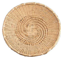
⑭ 白竹 そばざる (QZL-16) 1-2170-1401 8寸 φ240×H25 ¥3,710 1-2170-1402 7寸 φ210×H25 ¥3,510 1-2170-1403 6寸 φ180×H25 ¥3,160