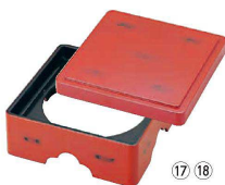
17 △ 柳川根来角6寸 (皿別売) 〈RYN-D4〉 W 1-2177-1701 本体 ¥4,770 180×180×H65 1-2177-1702 蓋 ¥3,740 180×180×H25