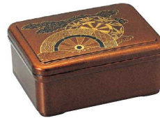
3 △ 合口丼重 梨地御所車内朱 〈RFK-92〉 W 1-2177-0301 ¥3,220 174×134×H80