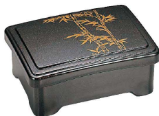
9 △ かつ重 竹 〈RDV-63〉 W 1-2177-0901 ¥2,880 187×136×H81