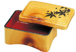
4 △ 殿方丼重 香林紅葉塗内朱 〈RFK-94〉 W 1-2177-0401 ¥4,490 178×135×H79