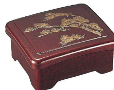
7 △ 光月丼重 タメパール松 〈RDV-60〉 W 1-2177-0701 ¥2,190 167×143×H80