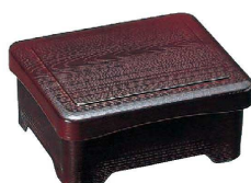
6 △ 木目丼重 溜内朱 〈RDV-59〉 W 1-2177-0601 ¥2,530 168×143×H72