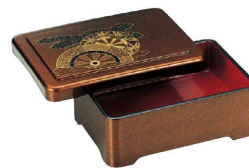
15 △ 天丼重 御所車内朱 〈RFK-93〉 W 1-2177-1501 ¥4,030 210×148×H80