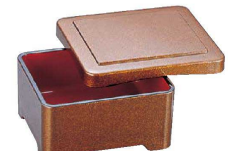
12 △ 象足丼重(小) 梨子地内朱塗 〈RDV-B8〉 W 1-2177-1201 ¥1,450 142×125×H70