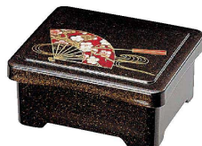
10 △ 耐熱象足丼重 梨地新扇内朱塗 〈RMS-L6〉 W 1-2177-1001 ¥2,900 168×143×H76