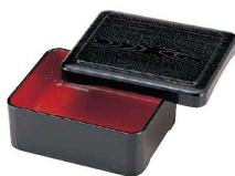
14 △ 爪掛新木目丼重 黒内朱塗 〈RDV-C1〉 W 1-2177-1401 ¥1,700 158×130×H64