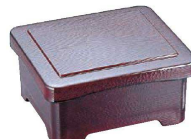
11 △ 象足丼重(小) 新木目溜内朱塗 〈RDV-B7〉 W 1-2177-1101 ¥1,450 142×125×H70