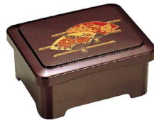
2 △ 和丼重 溜扇内朱 〈RFK-91〉 W 1-2177-0201 ¥2,880 164×132×H80