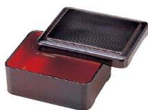
13 △ 爪掛干筋丼重 溜内朱塗 〈RDV-B9〉 W 1-2177-1301 ¥1,850 158×130×H64