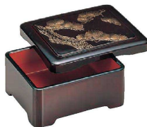
5 △ DX丼重 溜沈金松 〈RDV-57〉 W 1-2177-0501 ¥4,310 182×152×H80