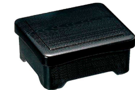
1 △ 耐熱木目丼重 黒内朱 〈RFK-90〉 W 1-2177-0101 ¥2,190 168×143×H72