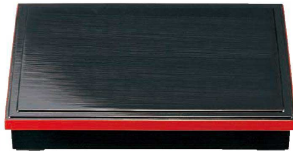
① △ 尺3千筋舟淵松花堂 黒淵朱(仕切別) 〈RFI-28〉W 1-2179-0101 ¥3,570 378×260×H63

① 尺3寸 松花堂シリーズ ※箱と仕切はそれぞれ別売です。お好みに合わせてお選び下さい。