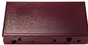
③ △ 尺3つぼつぼ 松花堂 溜内黒(仕切別) 〈RFI-30〉W 1-2179-0301 ¥6,900 375×256×H62