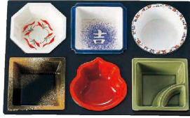
⑥ △ 尺3松花堂仕切 やすらぎ 〈RSU-26〉W 1-2179-0601 ¥5,060 353×236×H40