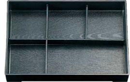
⑧ △ 尺3松花堂用B仕切 〈RFI-35〉W 1-2179-0801 ¥750 352×235×H40