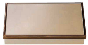
④ △ 尺3縁取松花堂 蓋淵銀内黒(仕切別) 〈RSU-25〉W 1-2179-0401 ¥10,010 382×260×H65