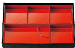
⑤ △ 尺3松花堂用 セパレート仕切 朱天黒 〈RFI-32〉W 1-2179-0501 ¥2,570 354×234×H42