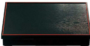
② △ 尺3木目松花堂 黒天朱(仕切別) 〈RFI-29〉W 1-2179-0201 ¥4,030 376×260×H63