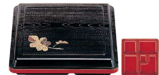
8 TA R6 耐熱赤坂弁当 黒新木目一枚菊内朱 (固定仕切) 〈RBV-C6〉 W 1-2184-0801 ¥4,800 250×250×H58