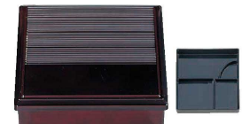
11 A R6 7寸角千筋弁当 溜(固定仕切) 〈RBV-96〉 W 1-2184-1101 ¥2,000 210×210×H55