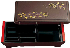
1 A R5 式部長手弁当 鉄仙(固定仕切) 〈RFK-R5〉 W 1-2184-0101 ¥3,340 295×170×H45

TA 耐熱ABS樹脂（耐熱温度約100℃ 洗浄機使用可能） 耐久性に優れ衝撃に強く割れにくい。塗料の密着も良好。