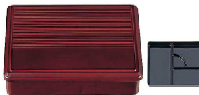
10 A R1 8寸長手固定弁当 溜(固定仕切) 〈RBV-A1〉 W 1-2184-1001 ¥2,600 243×190×H59