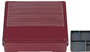
4 A R8 ニュー8寸角 固定弁当マルーン 〈RBV-88〉 W 1-2184-0401 ¥2,200 242×242×H63