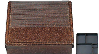
5 A R9 ニュー8寸角 固定弁当梨地 〈RBV-89〉 W 1-2184-0501 ¥2,300 242×242×H63