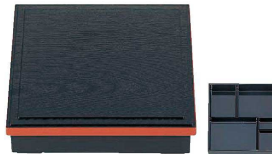
7 A R9 7寸角固定松花堂 黒木目淵朱(固定仕切) 〈RBV-93〉 W 1-2184-0701 ¥1,700 225×225×H60