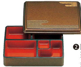
2 A R7 9寸 やすらぎ弁当 雲波内朱(固定仕切) 〈RFK-R7〉 W 1-2184-0201 ¥5,980 280×221×H70