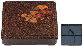
6 A R9 7.5寸角弁当 パールツタ(固定仕切) 〈RBV-92〉 W 1-2184-0601 ¥2,600 226×226×H53