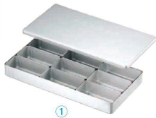
アルミ検食容器 (飲食店用)

① C型 C-9 〈AKV-16〉 1-0219-0101 ¥9,660 仲子 9ヶ入:305×155×H38