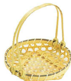
⑱ 百合 手付籠 (QTT-12)