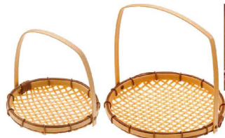
⑤ PP 手付ざる (QZL-21) 洗