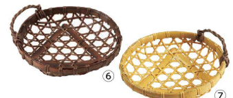
⑥ 樹脂 ユリカズラ付 茶 (QYL-01) 洗