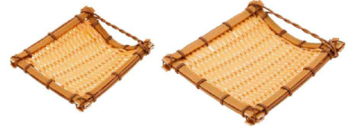
③ PP 箕皿 (QZL-19) 洗