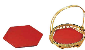
⑲ 塗り板 小 15cm用