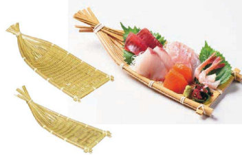
⑩ 白竹舟 (QSL-20) 目