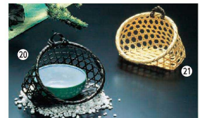
⑳ 染竹 せせらぎ籠