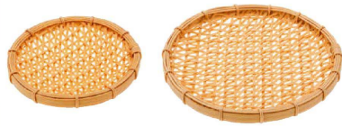
① PP ござ目ざる (QZL-17) 洗