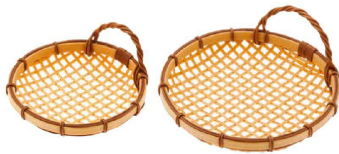
④ PP 耳付ざる (QZL-20) 洗