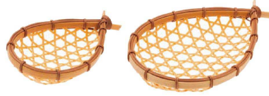
② PP 舟型ざる (QZL-18) 洗