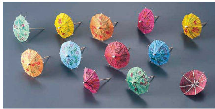
① 傘楊枝 SK-024(144本入) 入販 〈QYU-10〉 1-2198-0101 全長:100 ¥8,200